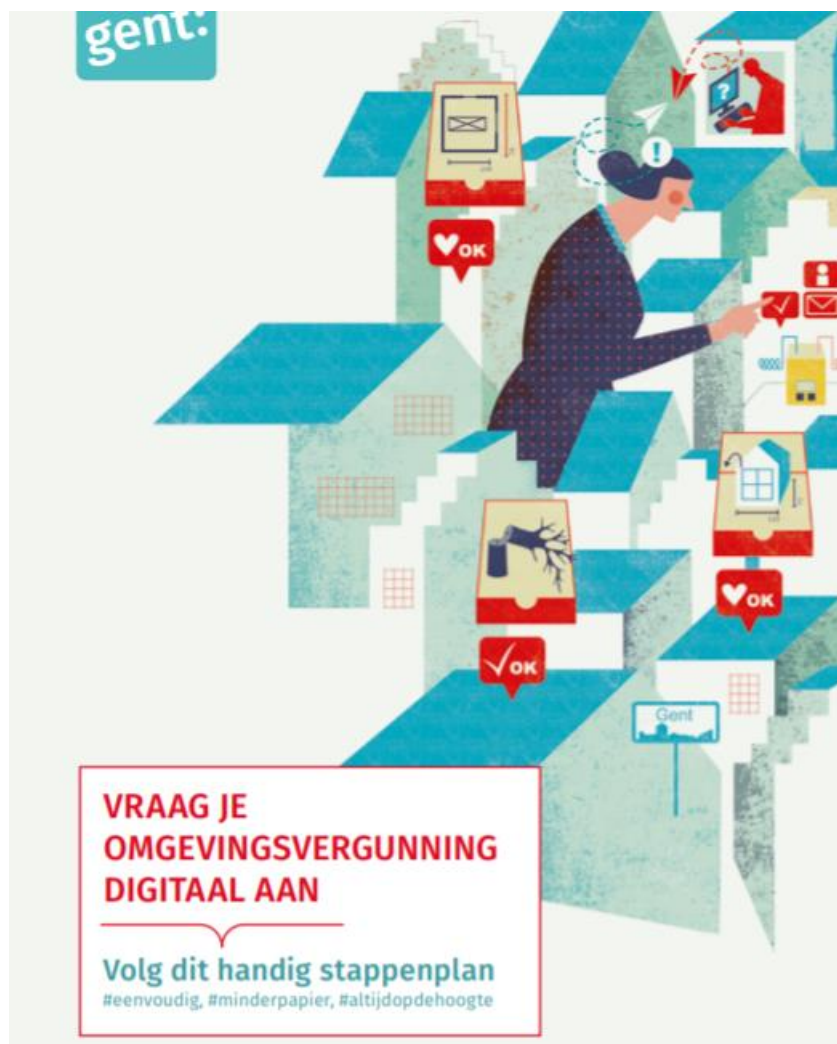
Figuur 9 Duidelijke procedures en goede handleidingen zijn essentieel

Als Stad moeten we erkennen dat de reorganisatie van de Dienst Stedenbouw niet onmiddellijk het verhoopde resultaat gaf. Deze situatie moet door extra personeelsinzet en vlottere werklijnen worden rechtgetrokken. Voor 2021 en 2022 voorzien we daarom 3 bijkomende stedenbouwkundige omgevingsambtenaren.