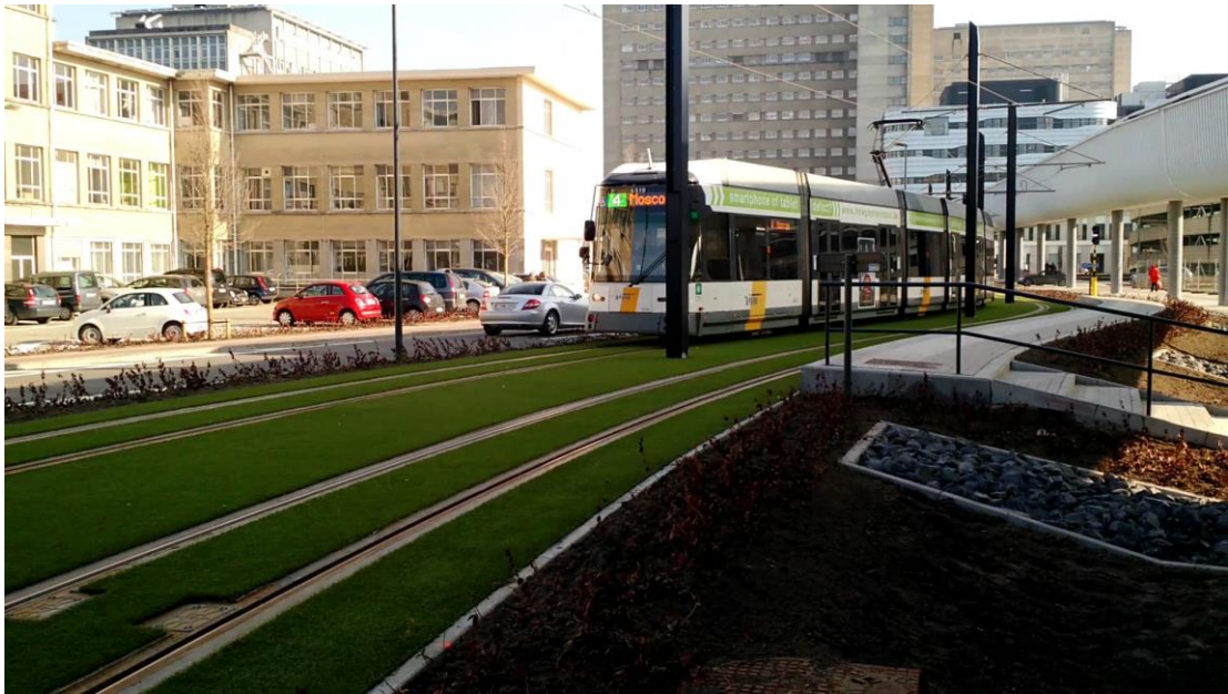
Figuur 18 Tram naar Universitair Ziekenhuis

Met een robuust openbaarvervoersaanbod voor ogen zijn het kortetermijnstadsnet en streeknet goede vertrekpunten. De sterke buslijnen van het kernnet komen overeen met de lijnen die al op de planning staan om te vertrammen. We werken dan ook verder aan het verlengen van lijn 4 tot aan de Dampoort ende vertramming van lijn 7 op middellange termijn en lijn 3 op lange termijn. Voor lijn 3 voeren we – samen met De Lijn – bijkomend onderzoek uit.