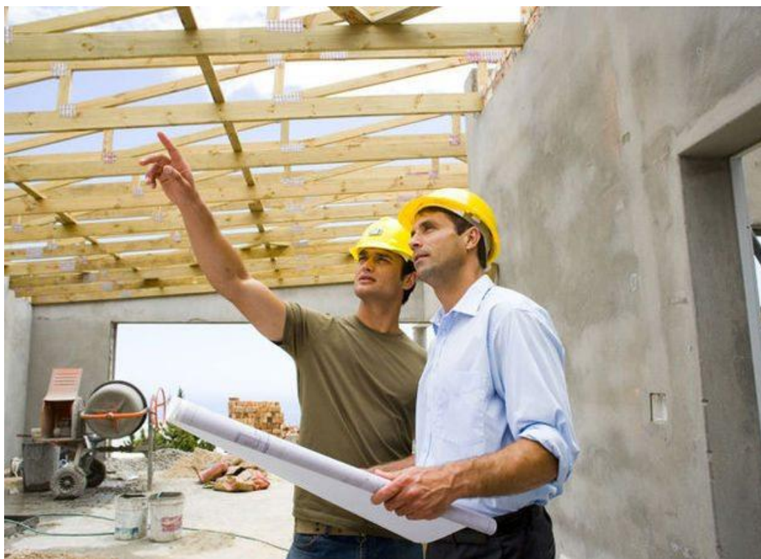
Figuur 3 Gentenaars vormen de stad

Als we ruimtelijk willen inspelen op nieuwe noden en behoeften, dan is het nodig om soepel te kunnen omgaan met ruimte. Ruimte voor Gent wijst op het belang van 'witruimtes' en ruimtes voor experiment. Als Stad hebben we daarom aandacht voor de verfrissende creatieve oplossingen waarmee Gentenaren op de proppen komen, zoals pop-upmoestuinen, pop-upstores in leegstaande panden of een tijdelijk pop-upnaaiatelier. We willen dergelijk tijdelijk gebruik, dat ruimtelijk inpasbaar is, faciliteren. Op deze manier stimuleren we ook het onderzoek naar en het effectief hergebruik van gebouwen. We evalueren de bestaande methoden om tijdelijke invullingen een plek te geven en passen ze aan indien nodig. We doen dit in samenspraak met de schepen bevoegd voor beleidsparticipatie en buurtwerk en, indien relevant, in samenspraak met de schepen van Facility Management (zoals bij buurtwerk dat experimenteert met tijdelijke opstellingen, fonds tijdelijke invullingen, ...).