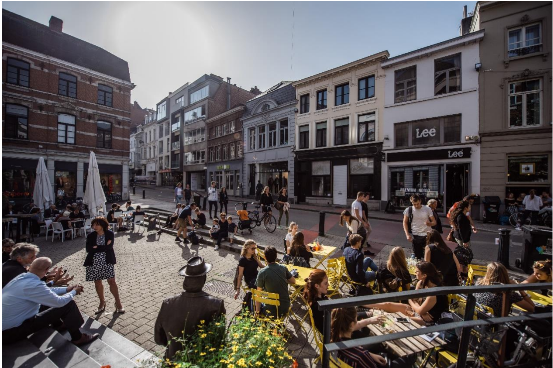
Figuur 16 Vele voetgangers in Gent

Gent rolt de rode loper uit voor voetgangers! Deze bestuursperiode willen we voor voetgangers dezelfde sprong voorwaarts maken als in de vorige bestuursperiode voor fietsers.