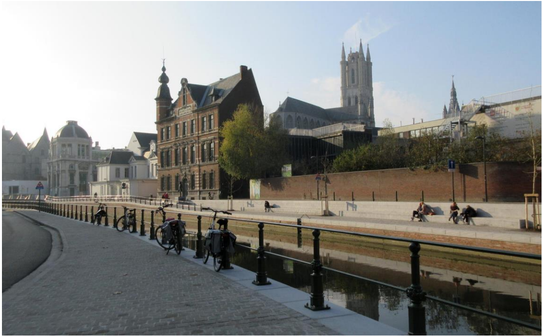
Figuur 12 De reep in Gent

Een cultuurhistorische kijk op de planvorming betekent een meerwaarde. Het in kaart brengen van waardevolle structuren, aanleg en authentieke materialen dient als inspiratie en aanknopingspunt voor toekomstige vernieuwende ingrepen. Op deze wijze gaan we ook verder met de ambitie om (verdwenen) waterlopen terug open te leggen op een duurzame wijze. Water in de stad zorgt voor verkoeling en aangename publieke ruimtes om elkaar te ontmoeten en te verpozen. Waar mogelijk maken we oude waterlopen terug zichtbaar of herkenbaar. We starten daarom de voorbereiding om de Kolveniersgang en Tichelrei terug open te leggen, verwijzend naar de Lievegang en het Meerhemkanaal. De plannen voor het Neuseplein scheppen ook mogelijkheden om opnieuw water richting Blaisantvest te laten stromen.