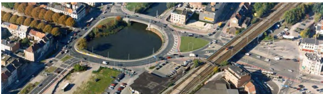
Figuur 19 De Dampoort

We blijven geloven dat een Gentse mobiliteitsbeheersmaatschappij essentieel is om snel en op maat voor de Gentse regio te kunnen werken. Het moet duidelijk zijn dat het niet enkel over auto-infrastructuur gaat maar ook over de leefbare inbedding van degelijke infrastructuur in de omgeving zonder de draagkracht te overschrijden. Enkel wanneer over alle vervoersmodi op een integrale manier wordt nagedacht, krijgen we een evenwichtige verdeling van geld en ruimte. Uit de lopende trajecten willen we ook leren om bij grote infrastructuurwerken proactiever te handelen, waardoor