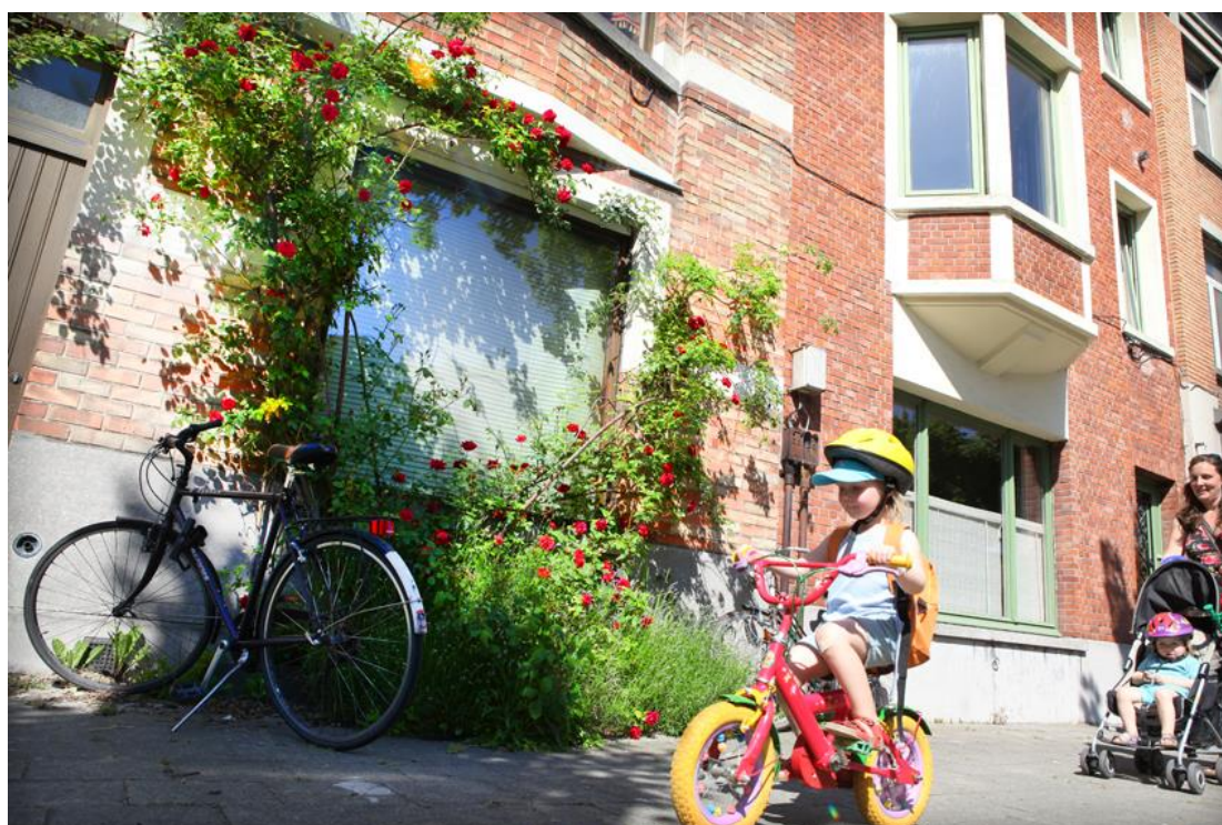
Figuur 1 Het goede leven in Gent

Gent biedt haar burgers kansen en kan een houvast zijn in een snel veranderende wereld. Als stad mee evolueren en een toekomstgericht beleid opzetten kan best samen met de Gentenaars gebeuren. Zo moet iedereen zich kunnen thuis voelen in Gent, en er alle kansen krijgen, zowel in ons stadscentrum als verschillende wijken en deelgemeenten. De grote verschillen in deze stad moeten zich weerspiegelen in het beleid dat dus niet enkel duurzaam en toekomstgericht maar ook inclusief moet zijn. Ook als het mobiliteit, publieke ruimte, stedenbouw, monumentenzorg, archeologie en archiveren betreft. Het betekent dat we voor het beleid niet vertrekken vanuit klassieke opgelegde schema's. Wel vanuit de wezenlijke behoeftes van burgers en met een voortdurende dialoog en samenspel. Zo is ook deze beleidsnota ontstaan: in overleg met tal van betrokkenen. Want zo doen we dat in Gent: met open geest met elkaar aan tafel gaan zitten.