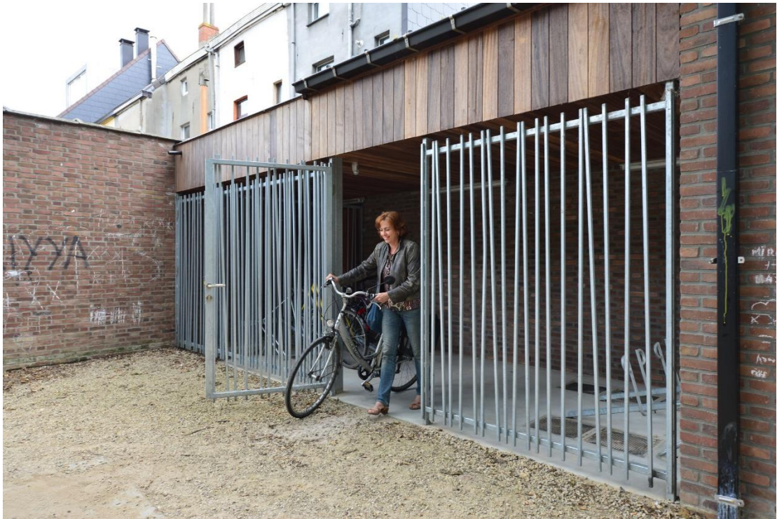
Figuur 22 Fietsenstallingen in verschillende vormen

We zetten in op parkeergelegenheid voor buitenmaatse fietsen, ook in de deelgemeenten, en zorgen dat fietsenstallingen drempelloos toegankelijk zijn.