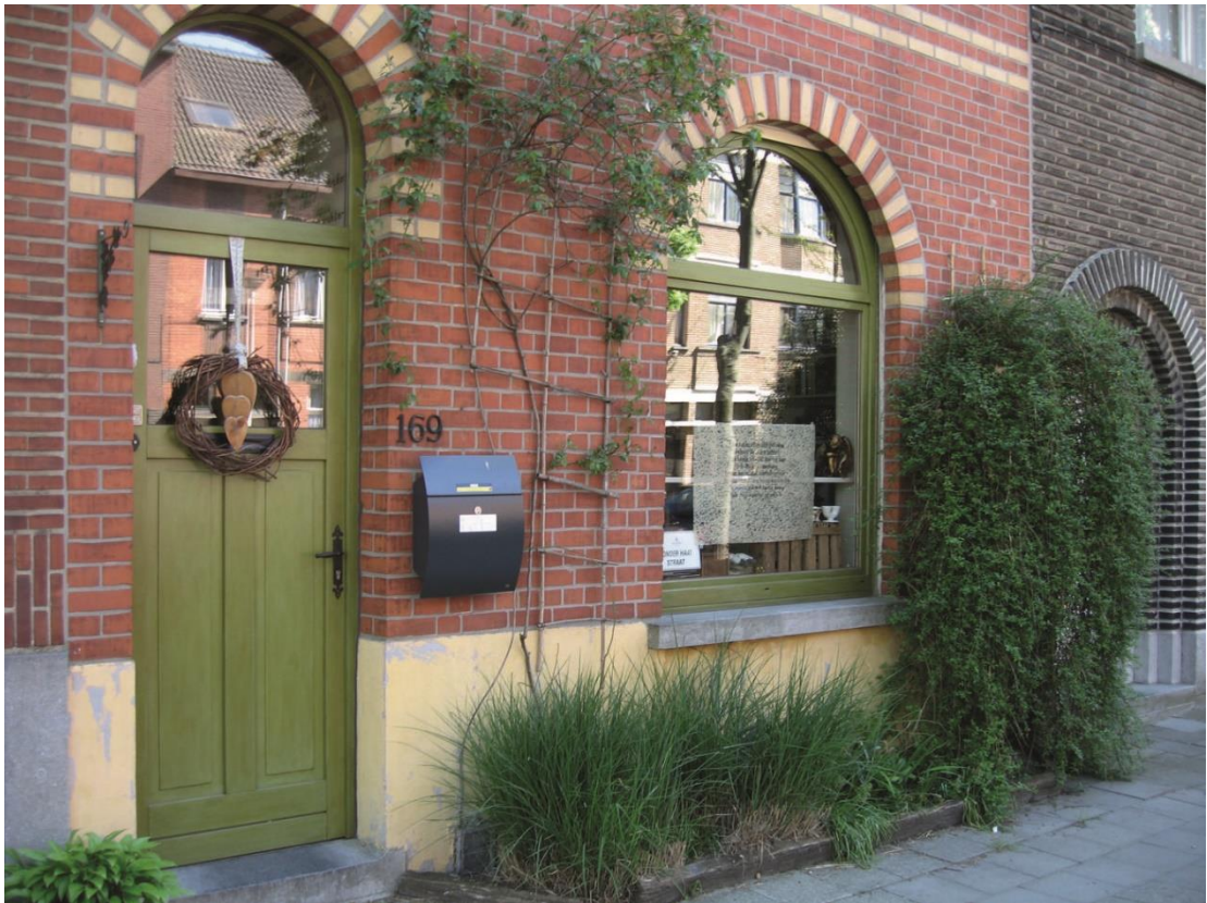
Figuur 14 Geveltuinen fleuren de stad op

Bij aanleg van nieuwe trottoirs willen we zoveel mogelijk drempels voor de aanleg van een geveltuin wegnemen. Daarom zullen we niet enkel het plantvak klaarleggen, maar ook de inrichting van de gehele geveltuinen aanbieden aan de bewoners die dit wensen. We doen dat in samenwerking met het GMF of de Geveltuinbrigade. Dit zorgt voor een snelle, onmiddellijk zichtbare ontharding en vergroening van de stad. Op vraag van de Minaraad en samen met de schepen bevoegd voor openbaar groen proberen we in een proefproject het principe uit waarbij standaard een geveltuin wordt aangelegd tenzij de bewoner aangeeft dat hij dit niet wil.