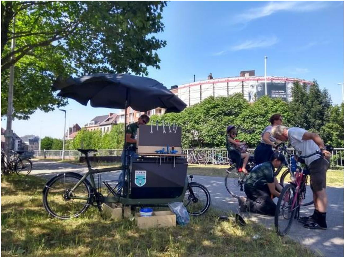
Figuur 21 De fietsambassade

De Fietsambassade voorziet moderne, veilige en comfortabele fietsenstallingen op het openbaar domein die op regelmatige basis onderhouden worden. De organisatie verhuurt fietsen in alle maten en vormen met een focus op beleidsrelevante doelgroepen zoals toeristen, studenten, pendelaars, gezinnen met kinderen, maar ook kwetsbare doelgroepen en senioren met een financiële beperking. Vanuit breed toegankelijke servicepunten wordt fietsherstel aangeboden als aanvulling op het bestaande aanbod. Bovenop de servicepunten bouwt De Fietsambassade een netwerk uit van fietspompen, de klok rond beschikbaar voor het brede publiek.