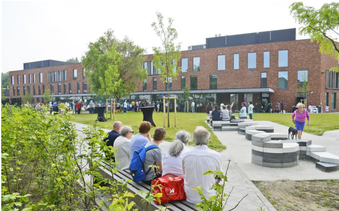
Figuur 7 Vergroenen en verweven is essentieel in de 19de eeuwse gordel

We ontwikkelen daarom een geïntegreerde verwevingstoets. Zo'n verwevingstoets is meer dan een louter ruimtelijke afweging. Het is een set van verschillende vragen over kenmerken die relevant zijn voor verweving binnen een goed geordende leefbare stad. Deze vragen behandelen ruimtelijke kenmerken die eigen zijn aan een specifieke locatie, maar ook sociale en economische kenmerken. Kenmerken met betrekking tot leefmilieu en klimaat, zoals de verhoogde groennorm, de sponswerking van de stad voor regenwater, hinder (lucht, geluid, licht...) en mobiliteit komen eveneens aan bod. Zo kan de verwevingstoets voor een gebied de verschillende behoeften, zoals groen, zorg, waterbeleid, klimaatrobustheid, economie, doorwaadbaarheid en (sociaal) wonen, precies afwegen.