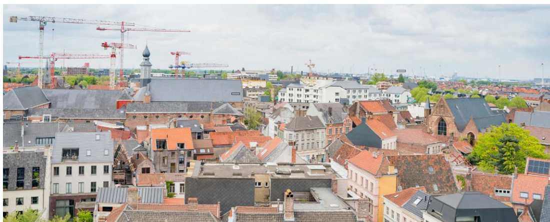
Figuur 2 Constant beweging in de historische stad

De Gentse ruimte is beperkt en dus moeten we zorgzaam omgaan met de groei van de stad. Daarom moeten we meer doen met de beschikbare ruimte, en dus moeten we verdichten en verluchten. Voor alle Gent-bouwers en architecten maken we werk van een transparante en kwalitatieve begeleiding van het traject voor omgevingsvergunningen. Bij bouwprojecten stimuleren we het verdichten en verluchten. Er zijn verschillende mogelijkheden om te verdichten: stapelen, delen, hergebruiken, tijdelijk gebruiken, stedelijk (her)verkavelen, vermijden van leegstand, optimaal ruimtegebruik, compacter wonen. Verluchten gaat om het openmaken van dichtslibbende ruimtes tussen huizenblokken.