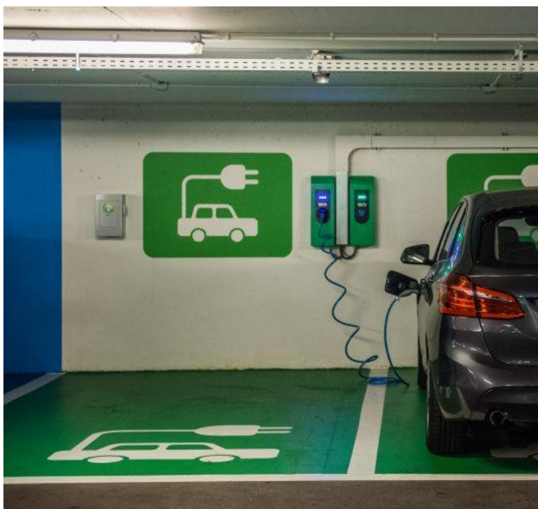
Figuur 23 Elektrische mobiliteit stimuleren

We investeren bijkomende middelen in de transitie naar elektrische mobiliteit en deelmobiliteit. We subsidiëren, samen met de schepen voor milieu, de elektrificatie van de standplaats taxi's om de doelstelling van emissie loze wagens te halen tegen 2025 en streven naar 50% elektrische deelauto's.