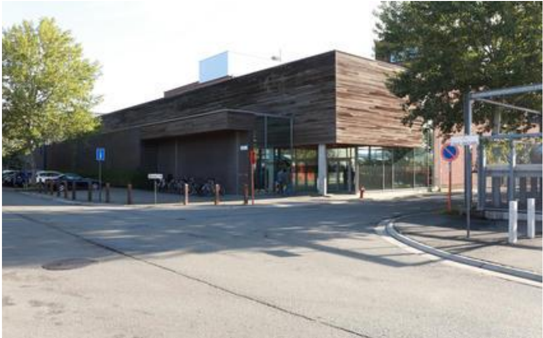
Figuur 26 De Zwarte Doos in Gentbrugge

We willen dat Gentenaren De Zwarte Doos met Archief Gent en het Archeologisch Depot ervaren als een deel van het collectief geheugen. We zetten in op een brede publiekswerking. Binnen De Zwarte Doos zetten we daarom een permanente tentoonstellingsruimte op voor Archief Gent en het Archeologisch Depot. Het erkend onroerenderfgoeddepot met zijn unieke stukken bezorgen we een grotere bekendheid. We willen de Gentenaar in De Zwarte Doos bijbrengen hoe de vele archeologische onderzoeken die uitgevoerd worden in het centrum en in de rand bijdragen tot de nieuwe stadsgeschiedschrijving.