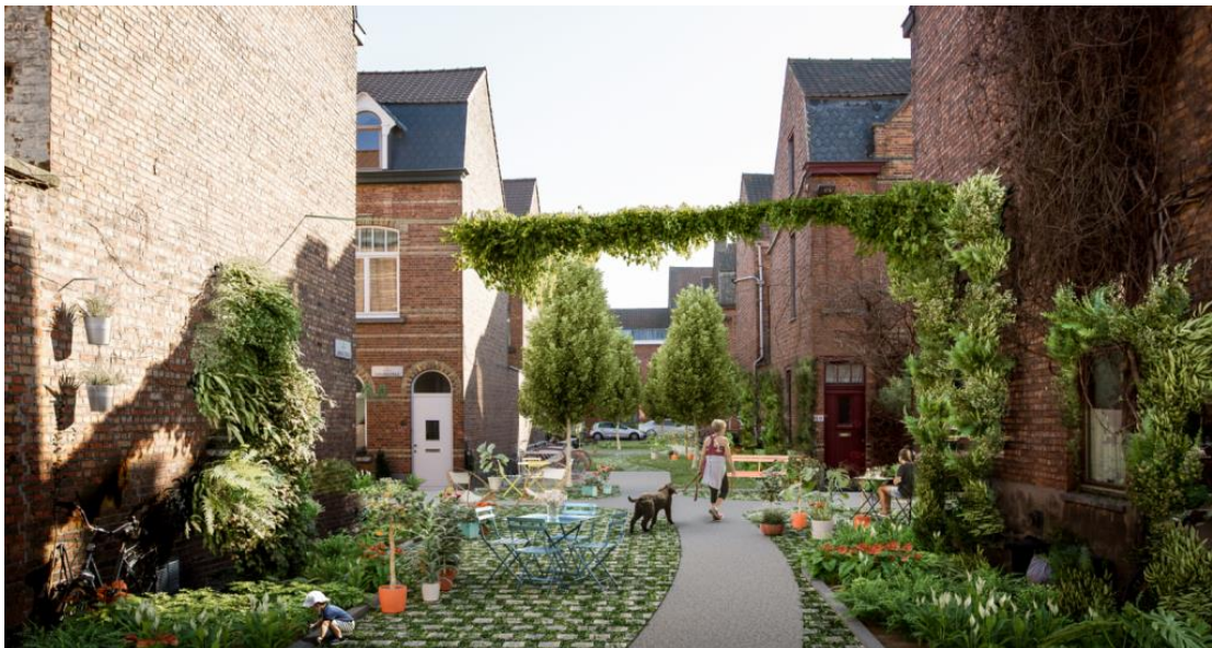
Figuur 13 Creatief en groener ontwerpen

Bij tijdelijke vernieuwing zoals trottoirvernieuwingen en topplaagvernieuwingen gaan we voor minder verharding en laten we heel bewust zones in stoepen en wegen onverhard. We bekijken altijd hoe voetgangers zich veilig en comfortabel kunnen verplaatsen (bv. via een eenzijdig voetpad, op de rijweg in luwe woonstraten of in erven).