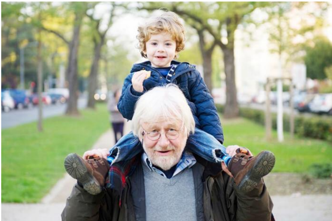
Figuur 11 Stad voor alle leeftijden

We willen dat ook kinderen, jongeren en ouderen de vrijheid hebben om zelfstandig door de wijk of de stad te wandelen of te fietsen. We nemen daarom ook het weren van subjectieve onveiligheid mee in het ontwerp van de publieke ruimte, en gaan voor een veilige, 'vergevingsgezinde' en leesbare inrichting van de publieke ruimte. De kwaliteit van een plek gaat niet enkel over hoeveel ongevallen er geregistreerd worden, maar over hoe graag voetgangers en fietsers komen, of zelfs: er graag even blijven en spelen.