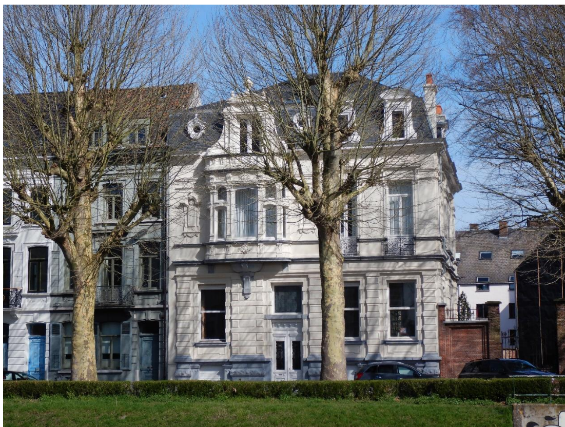
Figuur 24 Historisch erfgoed in Gent

We kunnen Gent - - onmogelijk vatten. Het verleden van deze stad is onnoemelijk rijk. Dat verleden tastbaar maken is niet gemakkelijk.