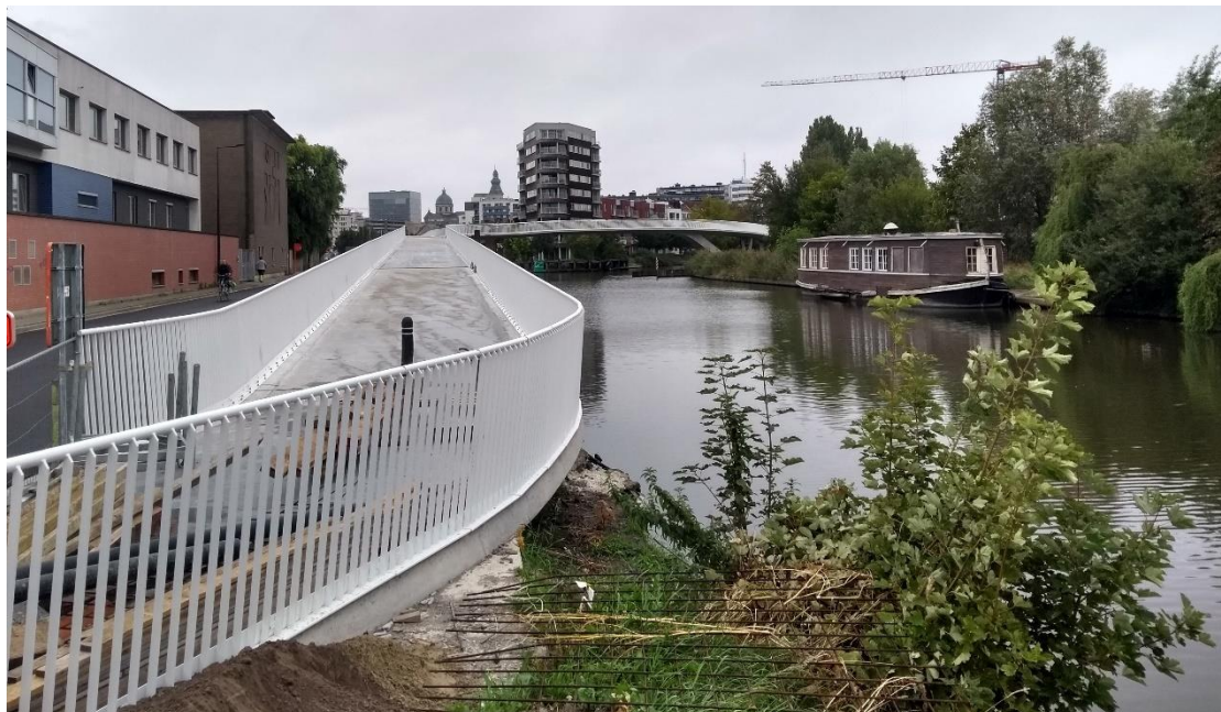
Figuur 17: Louisa d'Havébrug

We blijven investeren in nieuwe fietsbruggen en onderdoorgangen of de optimalisering van bestaande zodat de fietser belangrijke verkeersassen zoveel mogelijk conflictvrij kan kruisen. Hierbij denken we aan de Louisa d'Havébrug, de Watersportbaanbrug, de onderdoorgang onder de Contributiebrug, de onderdoorgang onder de Drongensesteenweg... We maken daarvoor een actieprogramma op.