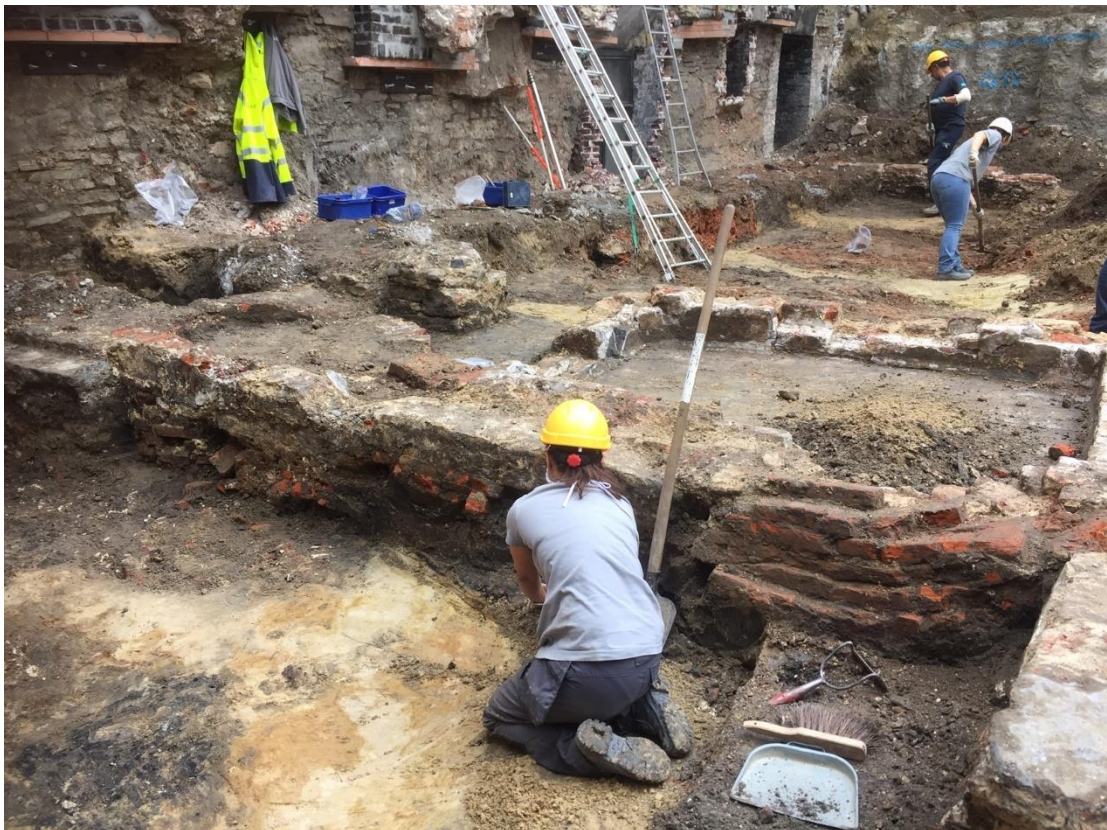
Figuur 25: Stadsarcheologen aan het werk op De Sikkel

We grijpen de heraanleg van straten en pleinen aan om het gemeentelijk subsidiereglement voor restauratie in te zetten, om beheersplannen op te maken en/of het aanwezige onroerend erfgoed een nieuw leven te geven. We visualiseren en duiden plaatselijke archeologische sporen, zoals ondergrondse muurresten, gedempte waterlopen of andere. Verschillende bestaande stedelijke dossiers, zoals Nieuwpoort, Kolveniersgang en Vijfwindgatenstraat, bieden hier mogelijkheden.