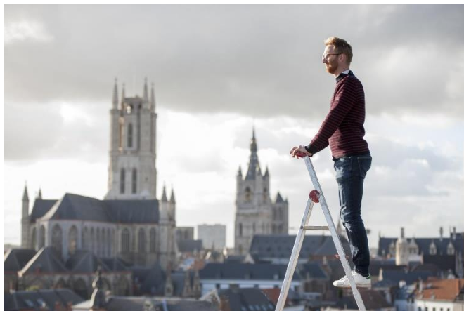
Figuur 4: de Stadsbouwmeester

Daarom wordt de werking van het team stadsbouwmeester verder uitgediept en ontplooid binnen de stedelijke organisatie. De stadsbouwmeester kan de identiteit van Gent versterken door de bouwcultuur uit te bouwen en door in debat te gaan met alle betrokkenen. Kritisch in vraag stellen en met open vizier ideeën uitwisselen zijn waardevolle Gentse