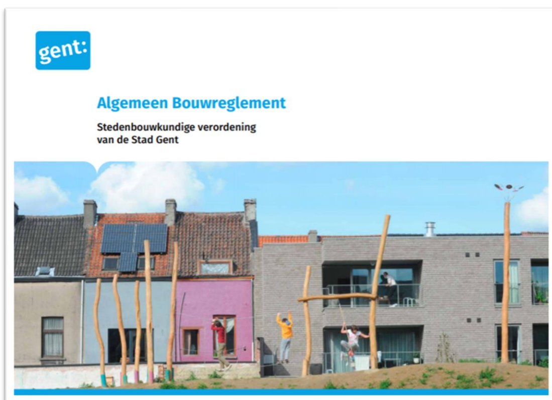
Figuur 6 Het Algemeen Bouwreglement als essentieel sturend instrument

Het Algemeen Bouwreglement (ABR) biedt een kader én juridisch houvast om de principes uit Ruimte voor Gent om te zetten in concrete bouwprojecten. Het zorgt er ook voor dat we constante kwaliteitseisen kunnen waarborgen. We houden het ABR actueel en geven het vorm als een leesbare, hanteerbare en compacte regelgeving.