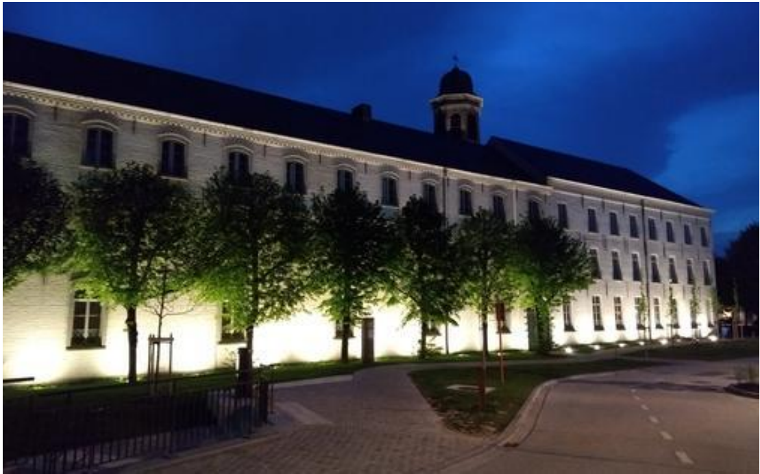
Figuur 15 Zorgvuldige verlichting zet het gebouw in de kijker

Hiernaast werken we ook aan een natuurverlichtingsplan. Te veel verlichting brengt onze natuur uit evenwicht en zorgt voor schadelijke effecten op fauna en flora. We kijken waar en wanneer op lokale Gentse wegen de verlichting kan gedoofd worden in bepaalde venstertijden met het oog op het terugdringen van lichthinder en onnodige verbruikskosten. We leren daarbij van andere steden en gemeenten.