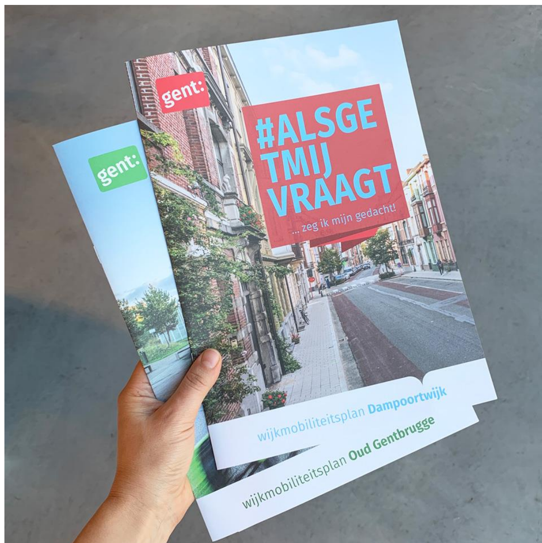
Figuur 20 Wijkmobiliteitsplannen voor Gentse deelgemeenten

De 7 wijken waarvoor een mobiliteitsplan wordt opgemaakt zijn: Dampoort-Oud Gentbrugge, Zwijnaarde, Sint-Denijs-Westrem, Sint-Amandsberg, Wondelgem-Kolegem-Bloemekenswijk, Ledeborg-Moscou en Muide-Meulestede.