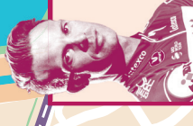
MIJN TIP BLAARMEERSEN