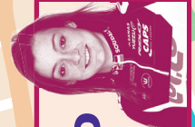
MIJN TIP ARBEDPARK