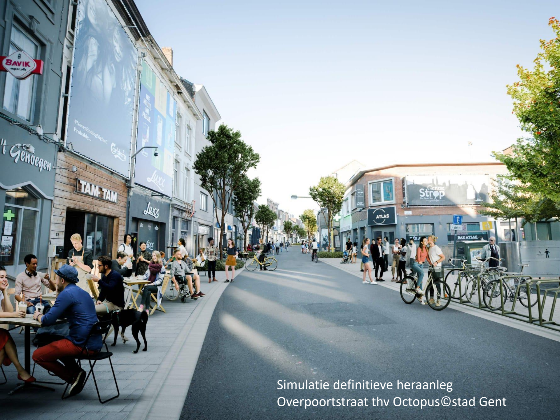
Simulatie definitieve heraanleg Overpoortstraat thv Octopus©stad Gent