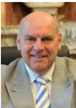
Daniël Termont Burgemeester Gent

Voor de Stad Gent en het OCMW blijft armoedebestrijding een permanent aandachtspunt en een absolute prioriteit. Want iederéén moet kunnen genieten van al het moois dat onze stad te bieden heeft!